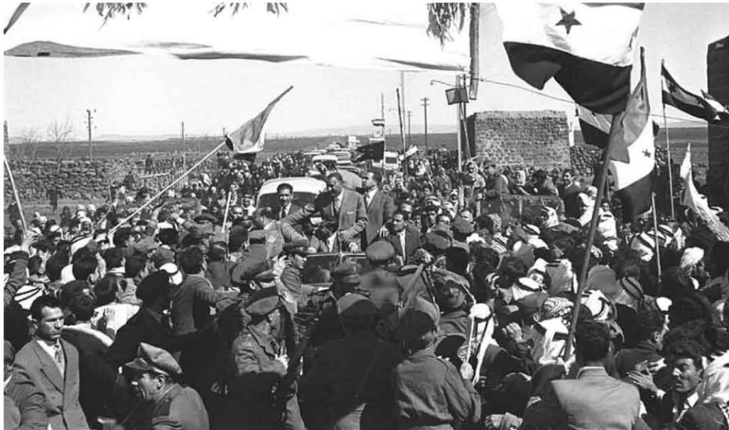
السويداء تستقبل الرئيس جمال عبد الناصر ١٩٦٠/٢/٢٤